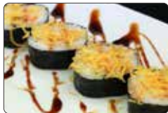
92. FUTO EBITEN tempura di gambero*, maionese con sopra patate dolci teriyaki € 6,50