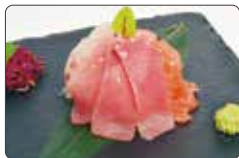
88. CHIRASHI MISTO riso, pesce misto, sesamo € 11,00