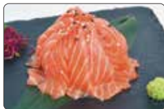
87. SAKE DON riso, salmone, sesamo € 8,00