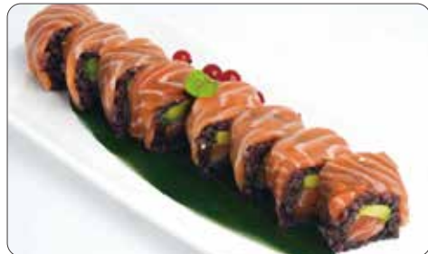
93. BLACK ROLL € 11,00 rotolo di riso venere con salmone, avocado philadelphia con sopra salmone

rotolo grande di riso con riso venere all'esterno