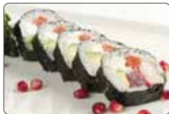
91. FUTO SPECIAL salmone, tonno, branzino, avocado, philadelphia € 6,00