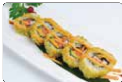
89. URA FUTO FRITTO salmone, avocado, surimi di granchio, maionese, sesamo, salsa piccante, teriyaki e sesamo € 6,50

rotolo grande di riso con alga all'esterno