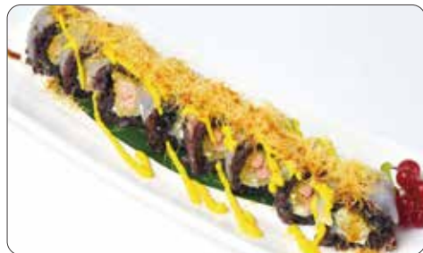
94. BLACK RED MIURA € 11,00 rotolo di venere con tempura di salmone, philadelphia avvolto da branzino con sopra pasta kataifi, salsa allo zafferano