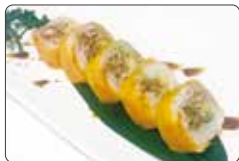
90. FUTO VILLAGE salmone cotto, philadelphia, avocado, salsa teriyaki da sfoglie di soia € 7,00